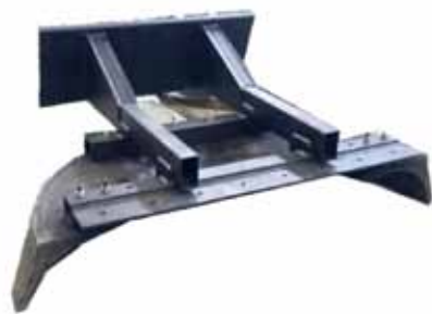
简易推粪机 Simple manure pushing machine