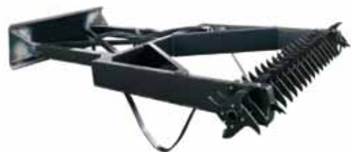
草垛开垦机 Haystack Reclamation Machine