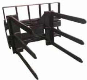
夹包叉 Fork Clamp