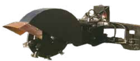
树桩打磨机 Stump Grinder