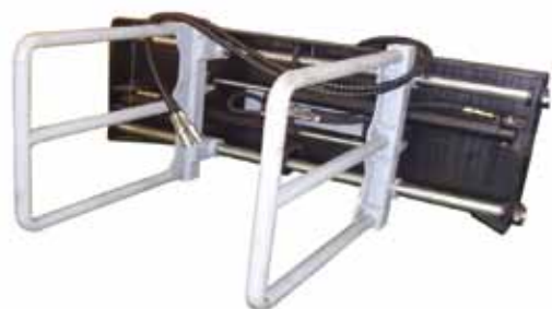
软包夹 Soft Clamp