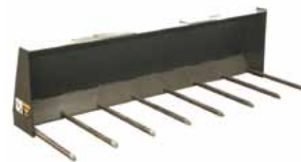
肥料叉 Utility Fork