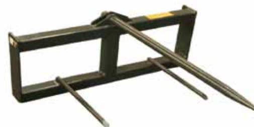
串杆 Bale Fork